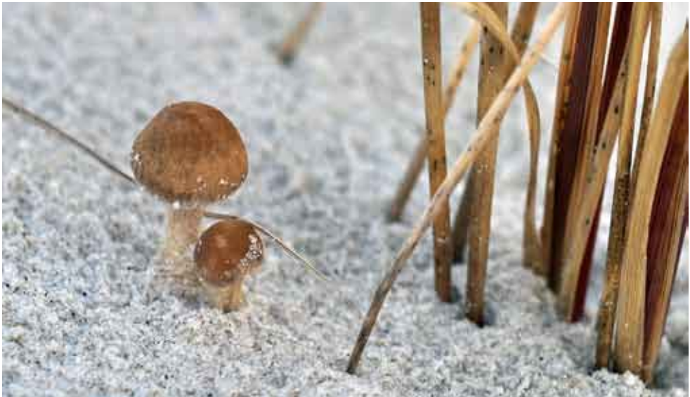
Fot. 10. Kruchaweczka piaskowa Psathyrella ammophila , ID: 188148.

1. Ładzice, 0,8 km N, pow. radomszczański, LD, DE-55; 05.09.2010; las mieszany; pniak drzewa liściastego(?); JN; fot., zieln. (BGF/BF/JN/100905/0002); ID: 180387.