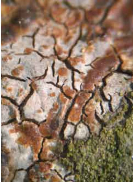
Fot. 12. Trzęsak różnobarwny Tremella versicolor , ID: 183547.

mieszany; pniak; MG; PPa; fot., zieln. (ZBŚRiL PAN, 10/MG/30.12.11); ID: 143635.