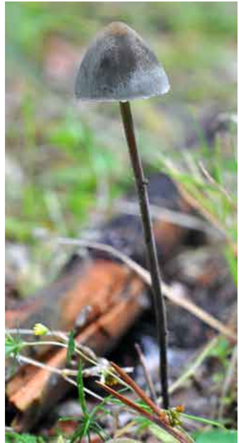
Fot. 6. Kołpaczek mierzwiowy odmiana drobnozarodnikowa Panaeolus papilionaceus v. parvisporus , ID: 189989.

1. Szczecin, 0,7 km E od wiaduktu autostrady nad ul. Morwową, pow. Szczecin, ZP, Puszcza Bukowa, AB-83; 26.12.2009; buczyna pomorska; gałąź bukowa; GD; fot., zieln. (ZBŚRiL PAN, 3/GD/3.01.11); ID: 156908, Fot. 7.