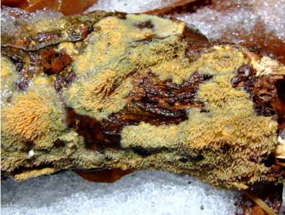
Fot. 7. Żyłak kolczasty Phlebia uda , ID: 156908.