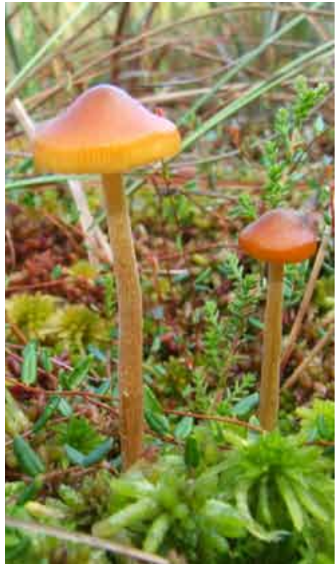
Fot. 5. Galerina hybrida , ID: 139141.

1. Bogucino, 1,5 km S, pow. kołobrzeski, ZP, BB-00; 30.08.2011; źródliko w borze sosnowym; pniak drzewa iglastego; TT; AK; fot., zieln. (ZBŚRiL PAN, 1/TT/24.11.11); ID: 193616.