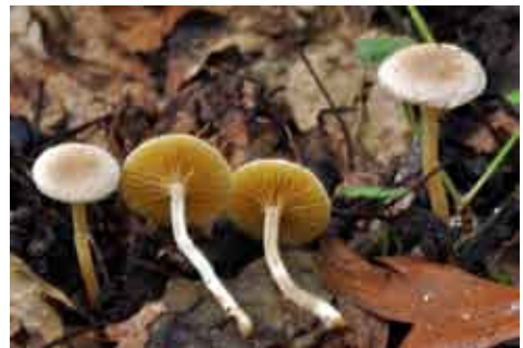
Fot. 13. Trąbka żółtoblaszkowa Tubaria dispersa , ID: 169315.

1. Poznań, pow. Poznań, WP, rez. „Żurawiniec”, BC-98; 21.09.2010; las mieszany; gałąź drzewa liściastego; AS; zieln. (ZBŚRiL PAN, 1/AS/10.02.11); ID: 181968.