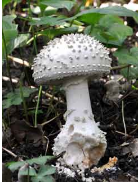
Fot. 3. Muchomor jeżowaty Amanita echinocephala , ID: 18424.

1. Lipnica Wielka, pow. nowotarski, MP, DG-26; 10.08.2010; las mieszany; ziemia;