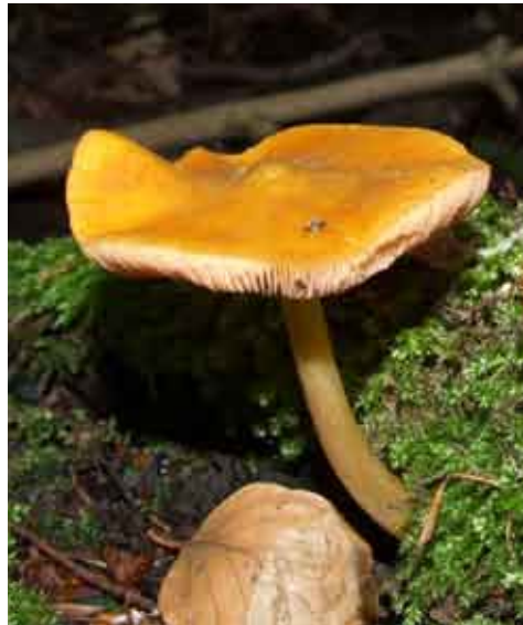
Fot. 9. Drobnoluszczyk żółtawy Pluteus leoninus , ID: 137677.

2. KądzIELNO 1,1 km SE, pow. kołobrzeski, ZP, Nadl. Gościno, oddz. 29b, BB-01; 13.09.2011; buczyna, skupisko jesionów; pniak drzewa