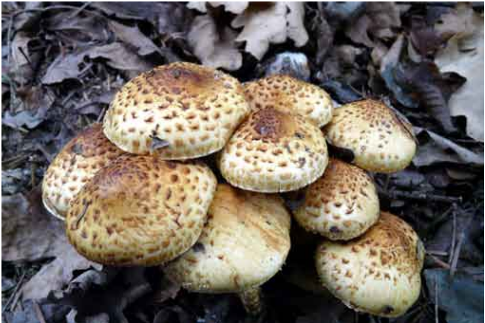
Fot. 8. Pholiota jahnii , ID: 195118.

1. Zyndranowa, pow. krośnieński, PK, FG-32; 12.09.2011; las jodłowo-bukowy; kłoda jodłowa; AH; fot., zieln. (BGF/BF/AH/110912/0001); ID: 194900.