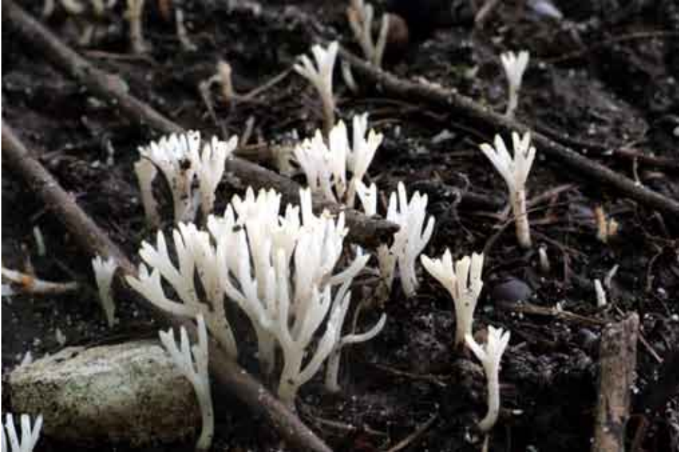
Fot. 11. Korolownik białawy Ramariopsis kunzei , ID:182037.

las liściasty; gałąź bzu czarnego; GD; fot., zieln. (ZBŚRiL PAN, 7/GD/4.01.11); ID: 125774.