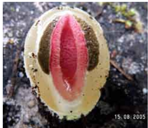
Fot. 15. Mądział malinowy Mutinus ravenelii , ID: 101995.

Geastrum quadrifidum (181292); Geastrum striatum (181274, 193824, 194304); Geastrum triplex (181273, 193848, 193850, 193991); Gloeoporus dichrous (194639); Grifola frondosa (192178, 195510); Gymnopilus junonius (184869, 194817); Helvella leucomelaena (185080); Hericium erinaceum (192238); Hygrophorus russula (194301); Hymenochaete tabacina (194734, 195479); Ischnoderma benzoinum (181247, 195476); Lactarius chrysorrheus (194614); Langermannia gigantea (190095, 191904); Lentinus cyathiformis (189181); Lepiota aspera (193990); Meripilus giganteus (189121); Morchella conica (185445); Morchella gigas (185530, 185657); Mutinus ravenelii (101995, Fot. 15, 190665, 190718, 191207, 191210); Paxillus rubicundulus (189808, 194302, 194786); Peniophora polygonia (180512); Phallus hadriani (195529); Phyllostopsis nidulans (182949); Pleurotus calyprtratus (185447); Porostereum spadiceum (189806); Porphyrellus porphyrosporus (189655); Pseudomerulius aureus (180898, 182356, 189789, 194638); Resupinatus trichotis (194650, 195484); Sarcodon squamosus (191205); Sarcoscypha austriaca (183865, 183866, 183867, 184467, 184552, 184569, 184570, 184571, 185431, 185434, 185435, 185437, 185439, 185440, 185442, 195248); Sparassis crispa (189103, 189494, 189675, 190526, 192171, 192172, 195219, 195487, 195438, 195440);