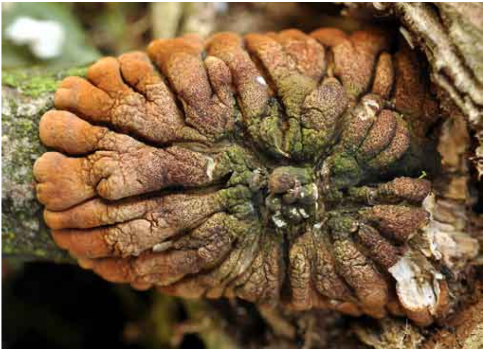
Fot. 2. Rozetka wierzbowa Hypocreopsis lichenoides , ID:193063.

3. Andrychów, pow. wadowicki, MP, Pańska G., DF-85; 05.05.2011; las mieszany; ziemia; JZ; PCh; fot.; ID: 186721.