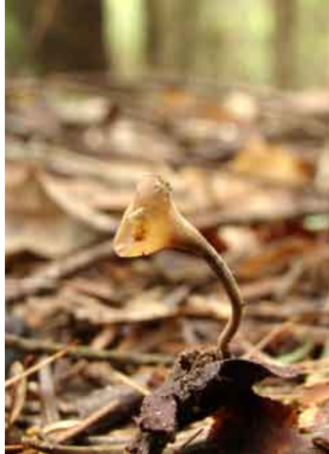
Fot. 1. Kubianka rudawa Ciboria rufofusca , ID: 185660.

2. Wejherowo, pow. wejherowski, PM, Puszcza Darżlubska, CA-57; 13.08.2011; las mie-