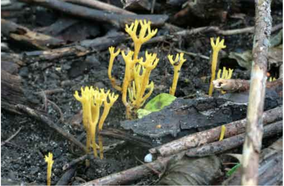
Fot. 4. Goździeniowiec mączny Clavulinopsis corniculata , ID: 182038.

ziemia; MG; fot., zieln. (ZBŚRiL PAN, 9/ MG/10.02.11); ID: 181937.