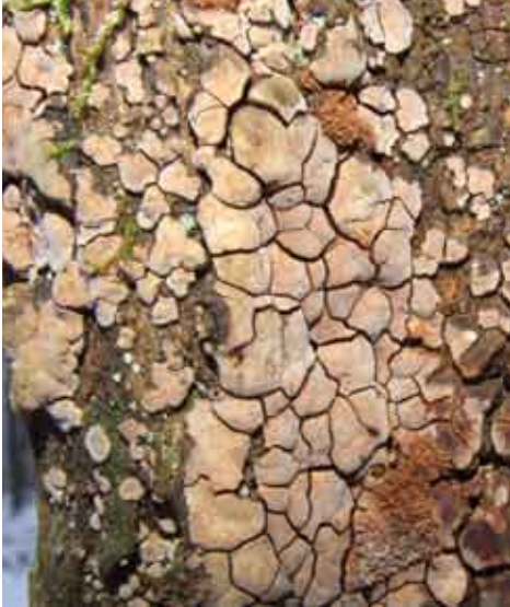
Fot. 14. Drewnowiec popękany Xylobolus frustulatus , ID: 157347, Fot. Grażyna Domian.

ną a łęgiem; ziemia; MiWR; MF; fot., zieln. (BGF/BF/MWR/080817/0002); ID: 110310.